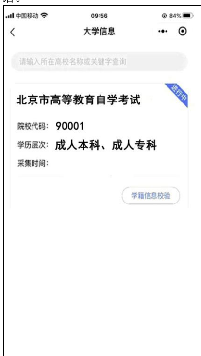
选择相应的学历层次