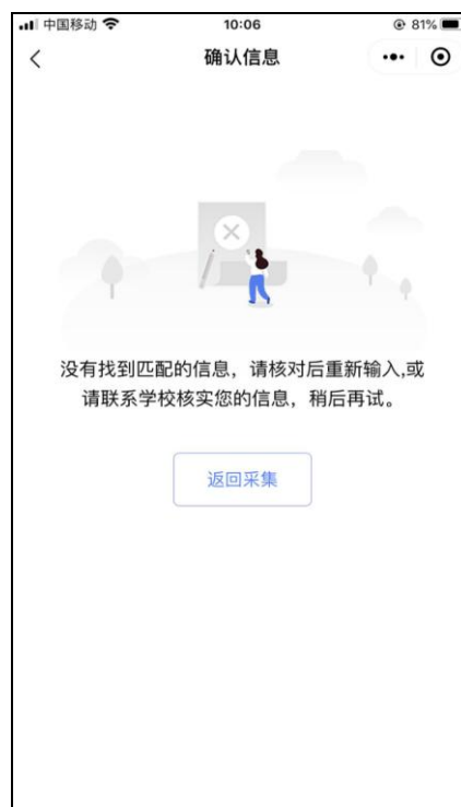
信息无法确认页面