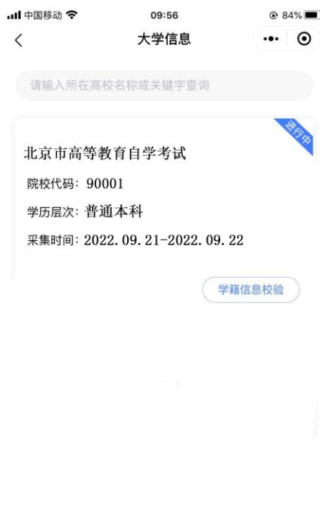
选择相应的学历层次

3. 选择相应的学历层次，进入校验信息页面，输入姓名、证件号码并授权微信联系电话